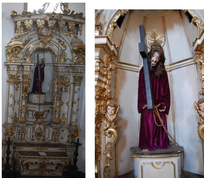
Foto3: Retábulo Cristo com a Cruz às Costas e Imagem (1)