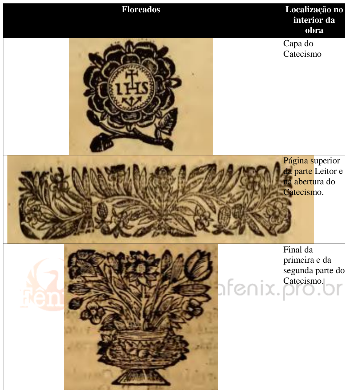
Quadro 3 – Floreados presentes no catecismo 18

Na Gramática, há dois elementos decorativos que são repetidos, como fica evidenciado no quadro 3, o entabalhamento fitomórfico, apresentado na abertura do texto dedicado ao leitor, e a rosa com o monograma da Companhia de Jesus. Se, no Catecismo , ela é utilizada para a capa da obra, na Gramática serve como alegoria para seu final. Ao constatarmos a adoção de recursos decorativos semelhantes pelo tipógrafo, percebe-se a ideia de continuidade dos livros, como se fizessem parte de uma mesma coleção. Outro elemento que denota a continuidade do Catecismo para a Gramática , é a