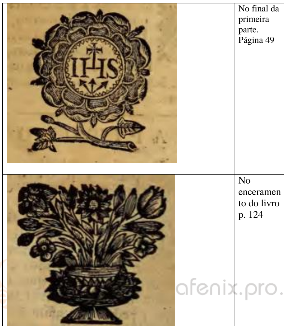
Quadro 4 – Floreados da gramática 20

Na parte superior da página de abertura do texto há um ornamento fitomórfico, com dois pelicanos nas laterais e um pelicano alado ao centro, conforme a figura nº 1. Vale lembrar que o pelicano evoca a ideia de sacrifício, 21 sendo também o símbolo do