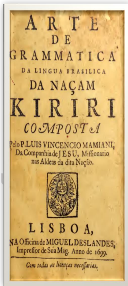
Figura 3: Capa da primeira edição da Arte de Grammatica da Lingua Brasilica da Naçam Kiriri . Lisboa: Officina Miguel Deslandes, 1699.

Já na capa do Catecismo , o monograma da Companhia é apresentado dentro de uma rosa. Ela é comumente utilizada como alegoria da perfeição. O monograma representa o nome de Jesus escrito numa forma grega abreviada, em latim Jesus Hominum Salvatori (Jesus, Salvador dos Homens). O I.H.S. foi popularizado pela primeira vez por São Bernardino de Siena, no começo do século XVI e, posteriormente, adotado pelos jesuítas. Na capa da Gramática , no lugar da rosa é utilizado um girassol.