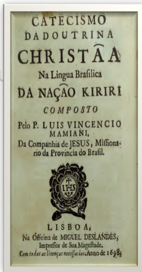
Figura 2: Capa da primeira edição do Catecismo da Doutrina Christã na Língua Brasileira da Nação Kiriri . Lisboa: Oficina Miguel Deslandes, 1698.

Essa continuidade dos textos é observada na lógica da impressão e no elemento decorativo da capa. A capa do Catecismo tem letras de destaque arredondadas que se alternam de tamanho, sendo dado maior destaque à palavra “Christã”. Os espaços entre as palavras, entre as letras e a disposição delas no papel asseguram a fluidez da leitura do título pelo leitor. As informações sobre o lugar de impressão, a tipografia e as licenças constam na capa. Nela, ainda encontra-se o monograma da Companhia, inserido dentro de uma rosa. Esse mesmo elemento iconográfico se faz presente na última página da Gramática .