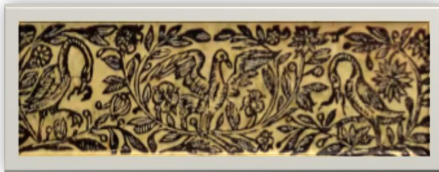
Figura 1: Alegoria dos pelicanos. In: Arte de Grammatica da Lingua Brasilica da naçam Kiriri . Lisboa: Officina Miguel Deslandes, 1699. p. 1

Papado. O pelicano desaparecia no verão e renascia no inverno, promovendo as analogias com a fênix e a ressurreição, e, também, o amor materno, já que a ave alimenta seus filhotes com o próprio sangue, ao dilacerar o seu peito.