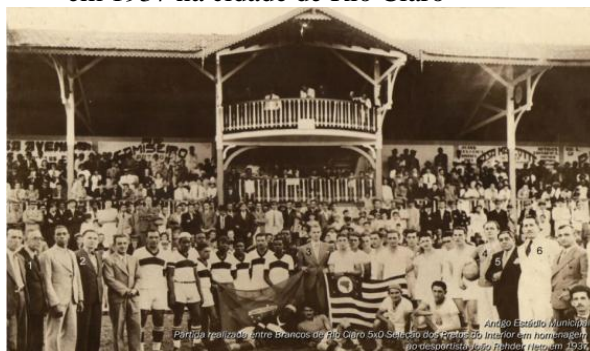
Imagem 3: Partida disputada entre o Rio Claro F. C. e a seleção de negros do interior paulista em 1937 na cidade de Rio Claro