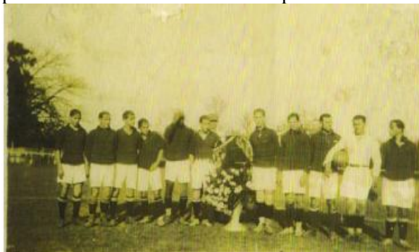
Imagem 2: Equipe de marinheiros ingleses do navio H. M. S Capetown que enfrentou o Rio Claro F. C. no campo do Grêmio Recreativo da Companhia Paulista de Estradas de Ferro