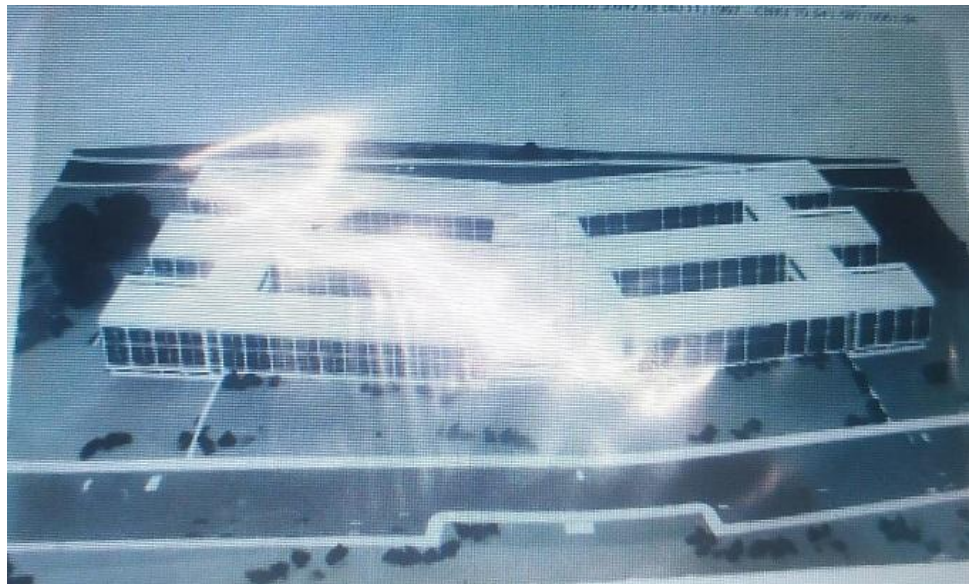
Imagem 6. Primeira maquete do novo prédio de 1990

localizada às margens da PRT-280. A proposta previa uma estrutura ampla capaz de fornecer todos os amparos necessários a uma Instituição de Educação Superior.