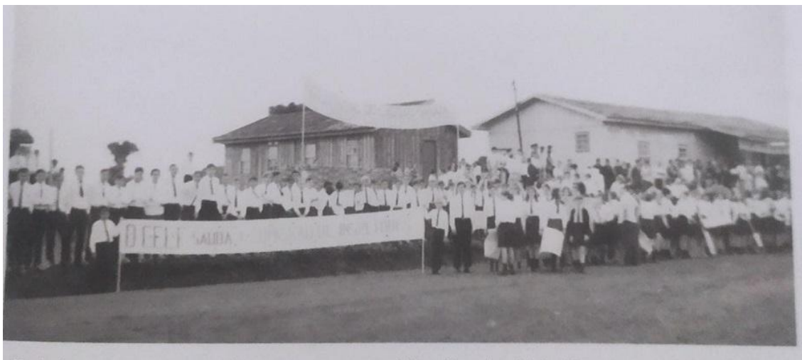
Imagem 4. Estudantes concentrados no aeroporto em 1968