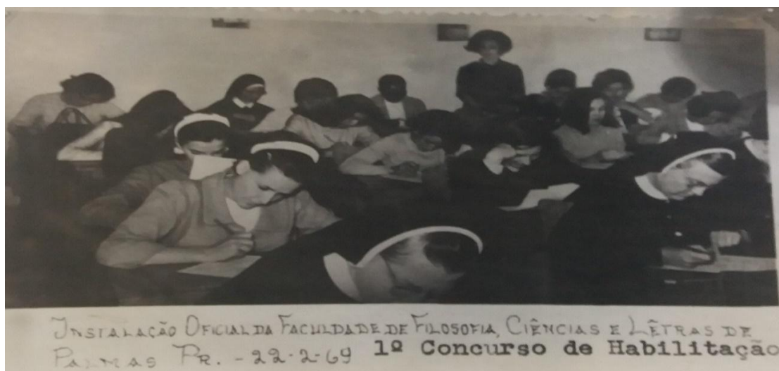
Imagem 5. Primeiro vestibular da FAFI em fevereiro de 1969