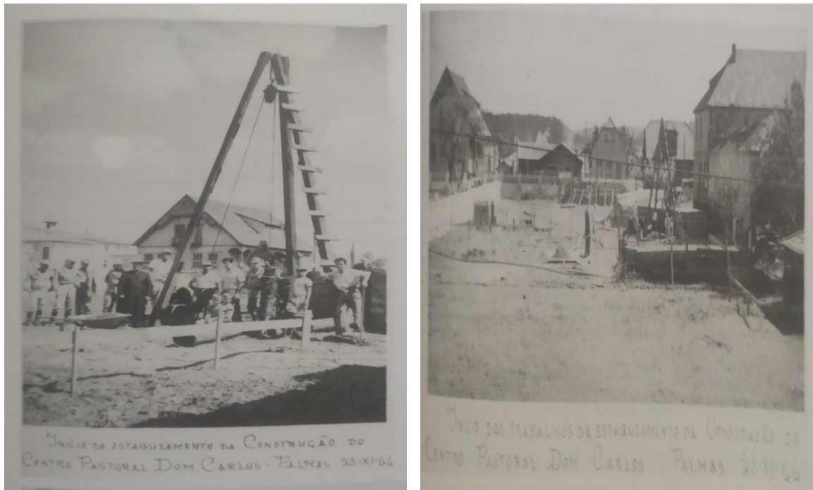
Imagem 3. Início da construção do Centro Pastoral, Educacional e Assistencial Dom Carlos 1966

Fonte: Mendes, Rodrigues e Rocha Filho (2002, p. 451).