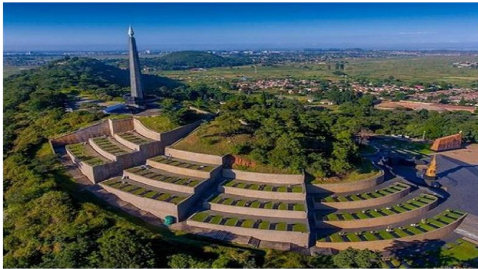
Figura 1. National Heroes Acre (em Harare, Zimbábue)