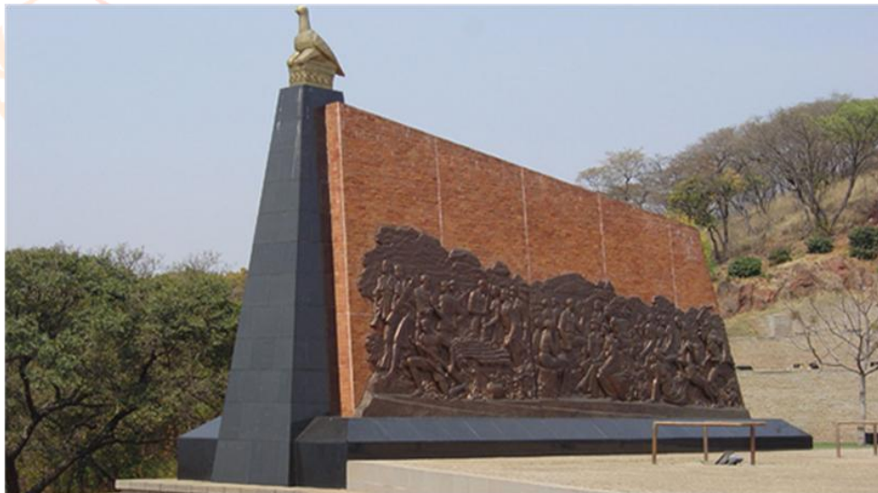
Figura 2. Os painéis de bronze e o mural do National Heroes Acre (em Harare, Zimbábue).