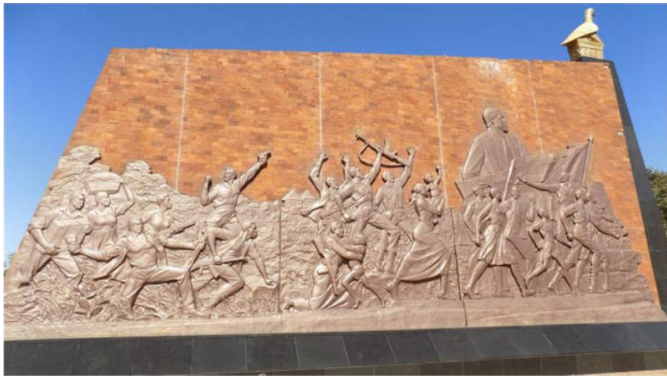
Figura 3: Os painéis de bronze e o mural do National Heroes Acre (em Harare, Zimbábue),

Fonte: HEROES ACRE to be ‘truly monumental’. The Herald (online). Disponível em < https://www.herald.co.zw/heroes-acre-site-to-be-truly-monumental/ > Acesso em 30 mai. 2024.