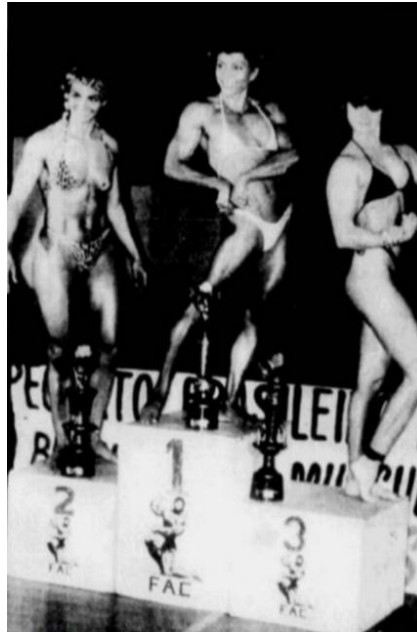
Figura 1. Fisiculturistas no palco, 1987