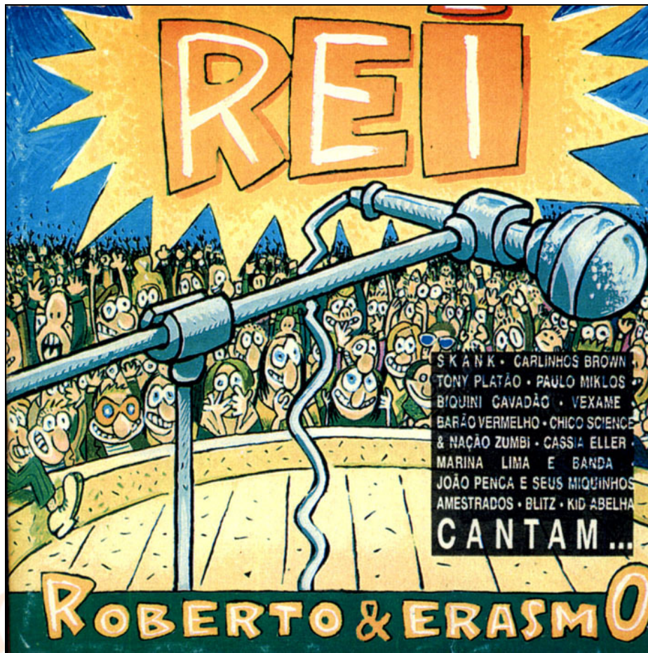
Fig. 5 – Capa do CD de 1994 em que vários jovens artistas que não viram a Jovem Guarda recriam clássicos de Roberto e Erasmo.