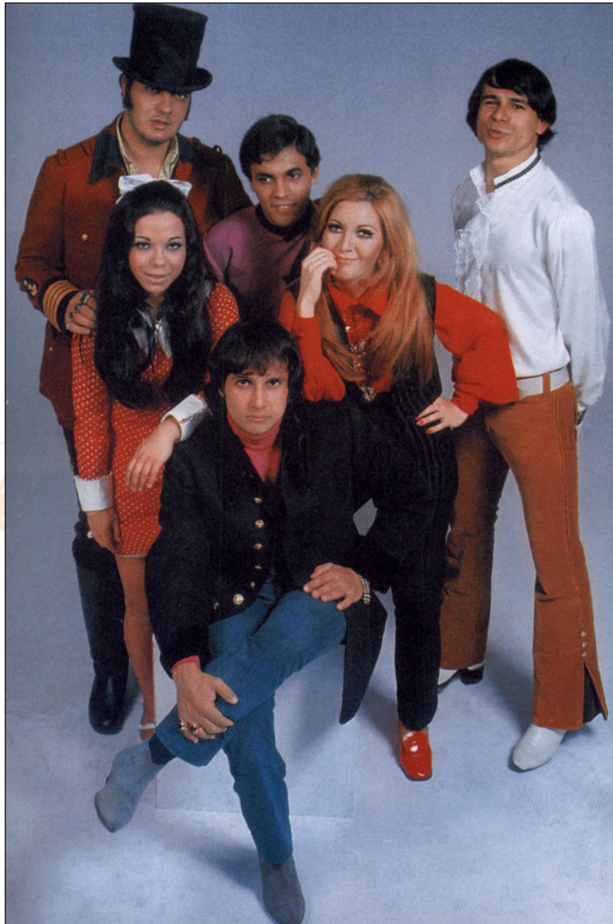
Fig. 1 – Os ícones da Jovem Guarda: Erasmo Carlos, Wanderley Cardoso, Eduardo Araújo, Martinha, Wanderléa e Roberto Carlos e o jeito pop que embalou sua geração.

Não apenas os jovens, mas gente de todas as idades, ainda inocentes dos anos negros que estavam apenas se iniciando, tinham seu lugar cativo na frente da telinha naquelas jovens tardes de antigos domingos. 4