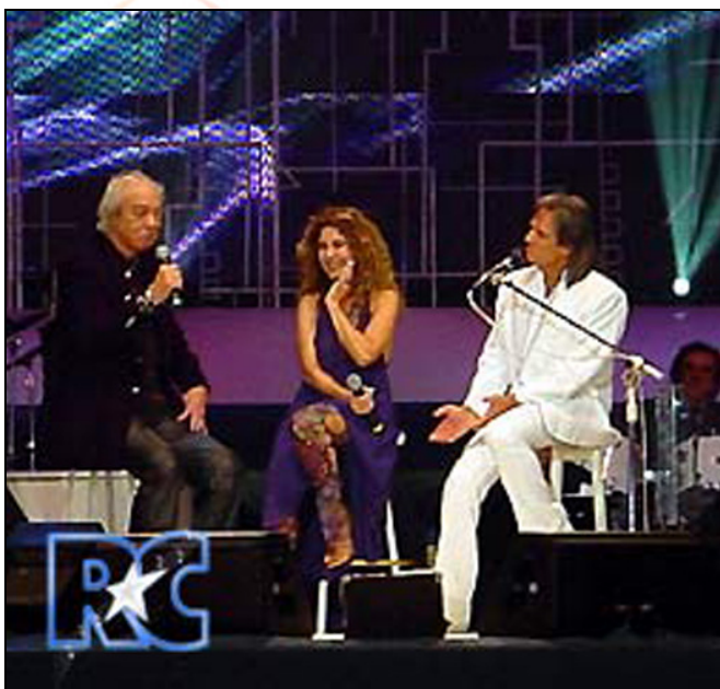
Fig. 6 – Os dois amigos convidam Wanderléa para juntos cantarem “Sentado à beira do caminho” num dos especiais de TV do Rei.

Aprendemos com eles a confessar nossas tolices, detalhes , a nomear nossas