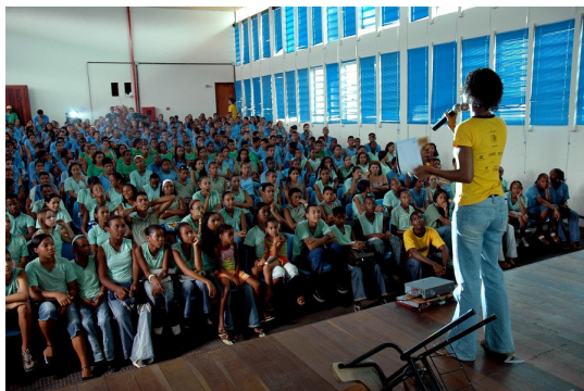
Figura 2 – Debate com a platéia da peça Cuida Bem de Mim

faz isto: só ele lança o poema para diante de nossos olhos, e só ele lança e entrega a integridade de uma existência”. 5