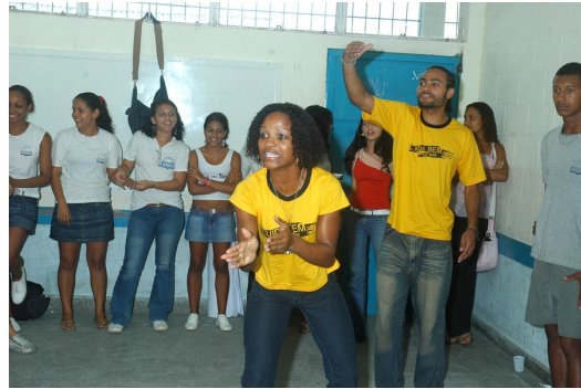
Figura 4 – Ações Educativas do projeto Cuida Bem de Mim

reverberação da peça, desdobrando-a em eixos teóricos e temáticos nas aulas e projetos diversos que são criados após as soluções levantadas.