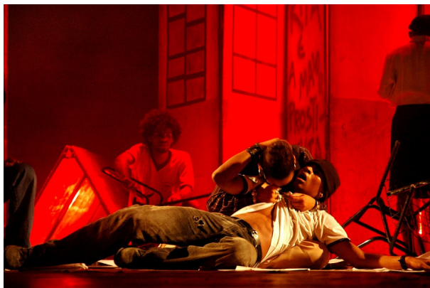
Figura 3 – Cena Final da peça Cuida Bem de Mim

É importante esclarecer também, que este espectador do Cuida Bem de Mim foi mobilizado com as ações educativas na escola antes da apresentação da peça e pode ser preparado para ver uma obra teatral que fala do seu mundo, que é a escola pública (Figura 3). Efetivando-se neste momento a mediação, que nesta experiência se torna mais importante, pois, como defende Bordieu