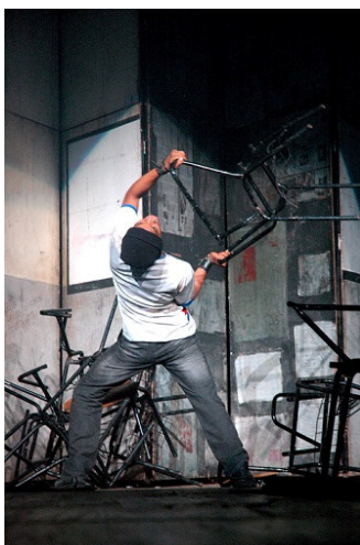
Figura 1 – Cena da destruição das escolas na peça Cuida Bem de Mim