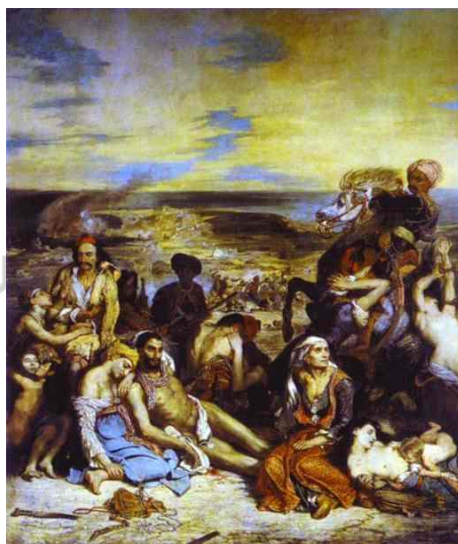
Figura 6: Eugene Delacroix, O Massacre em Chios , óleo sobre tela, 1824 - Museu do Louvre, Paris

Delacroix carregava o espírito de seu tempo. Em suas obras, vemos um delineamento estético marcado pela intensidade (no uso das cores); pela audácia (em relação aos temas) e uma profunda dramaticidade (no movimento das imagens que criava).