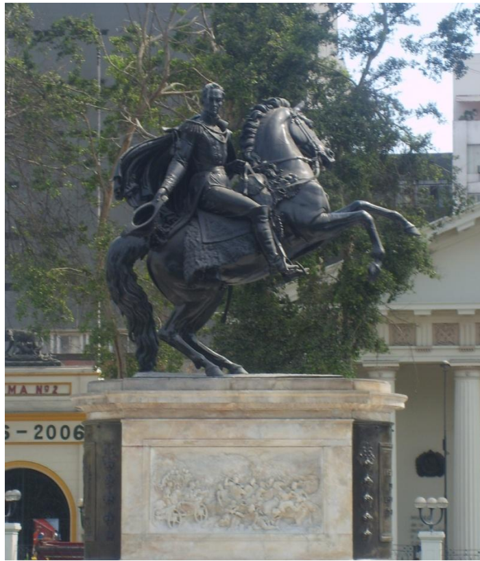
Figura 9: Simon Bolivar, monumento de 1859. Localizado na Praça do Congresso, Lima, Peru.