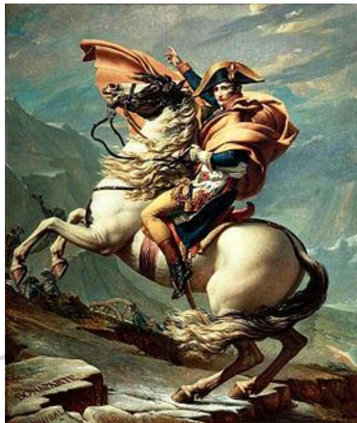
Figura 5: Jacques-Louis David, 1800, Óleo sobre tela, 260 cm × 221 cm, Château de Malmaison, Musée national Du château, RueilMalmaison

David e Gros expressaram com cores firmes o mote heroico e guerreiro do fim do século XVIII e início do XIX. Para esses pintores, o indivíduo se constituía na alma do mundo. Tanto David quanto Gros tentavam personificar a razão, a força e a liberdade no herói ou no gênio condutor da guerra. É valorização do indivíduo em detrimento dos resquícios da vida solidária das comunidades. O modelo a ser seguido pela nação consolidava-se na figura do herói. Para Gros, por exemplo, Napoleão é a marca desse herói, esse sujeito concentrador de todos os sonhos e anseios. Napoleão foi transformado em mito e passou a significar a somatória dos desejos individuais.