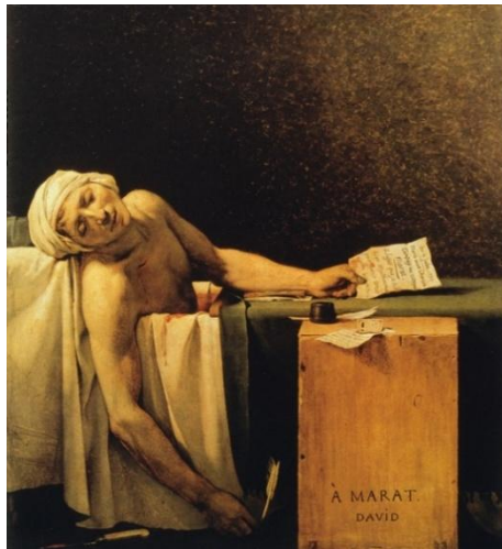
Figura 3: A Morte de Marat, 1793. A Morte de Marat, 1793, Óleo sobre tela, 124,70 x 161,90 cm, Museu de Belas Artes de Bruxelas, Bélgica

A força da heroificação pode ser vista na obra “ A morte de Marat ” (figura 3) de 1793.