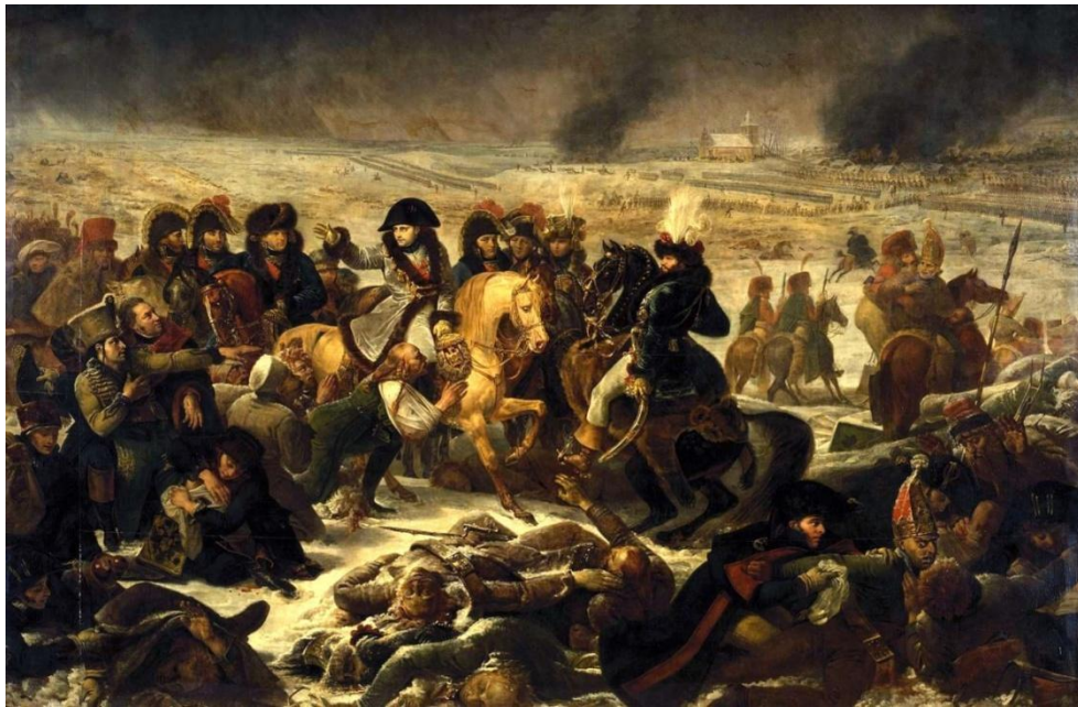
Figura 4: Napoleão no campo de batalha de Eylau, 1807. Antoine-Jean Gros, 1808, Óleo sobre tela, 521 X 784 cm. Museu do Louvre, Paris, França

Em A Batalha de Eylau (figura 4) encontramos em Gros o artista marcado por um sentimento heroico. No centro de seu quadro, Napoleão configura-se como o herói de todas as guerras. Montado em seu cavalo e rodeado de generais, tem ao fundo o desenrolar da movimentação do exército, encarnando a figura do líder supremo, invulnerável e onipotente. Na parte inferior do quadro, os derrotados. Entre mortos e feridos, destacam-se os subjugados pedindo clemência, ajoelhados diante da águia imperial que Napoleão segura com sua mão esquerda.