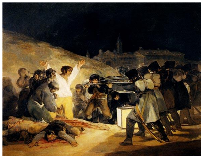
Figura 8: Os Fuzilamentos do Três de Maio de 1808 (1814), Francisco de Goya. Óleo sobre tela, 268 X 347 cm. Museu do Prado, Madri, Espanha.

No Colosso (figura 7), símbolo de sua fé na força popular é nítido o apelo à necessidade de o povo levantar-se contra a tirania. O Colosso , o grande monstro em pé, simboliza o povo que se levanta forte em posição de combate. O autor, que segundo alguns estudiosos não teria sido Goya, queria vê-lo representado como invencível na luta contra a opressão, a ruína, o atraso e a miséria.