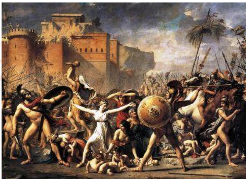
Figura 1: DAVID, Jacques Louis, O Rapto das Sabinas , Museu do Louvre, França, Paris, óleo sobre tela 385 x 522 cm.

Em seu quadro O Rapto Das Sabinas (figura 1), iniciado em 1794 e concluído em 1799, David reconstituiu de forma inigualável a visão da guerra, da violência e da multidão. Seus contemporâneos acreditavam ter sido esse quadro uma expressão do clamor pela conciliação no conflito civil que tomou conta da França após a queda da Bastilha.