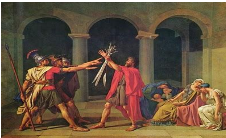
Figura 2: DAVID, Jacques Louis, O Juramento Dos Horácios .1784, óleo sobre tela, 330 X 425 cm, Museu do Louvre, Paris, Foto Douglas Lambert de oliveira. (COLI, Jorge. O Corpo da Liberdade . São Paulo: Cosac Naify, 2010.)

No Juramento dos Horácios (figura 2), datado de 1784, David trata também da guerra e o conflito gerado entre o dever patriótico e o amor à família. A família era uma instituição que existia desvinculada da pátria ou mesmo da nação. No momento das guerras revolucionárias e da consolidação do Estado-nação houve a necessidade de aproximar a família da ideia de nação. Daí o esforço da iconografia em criar uma relação abstrata, pois essa relação daria forma ao estado nacional.