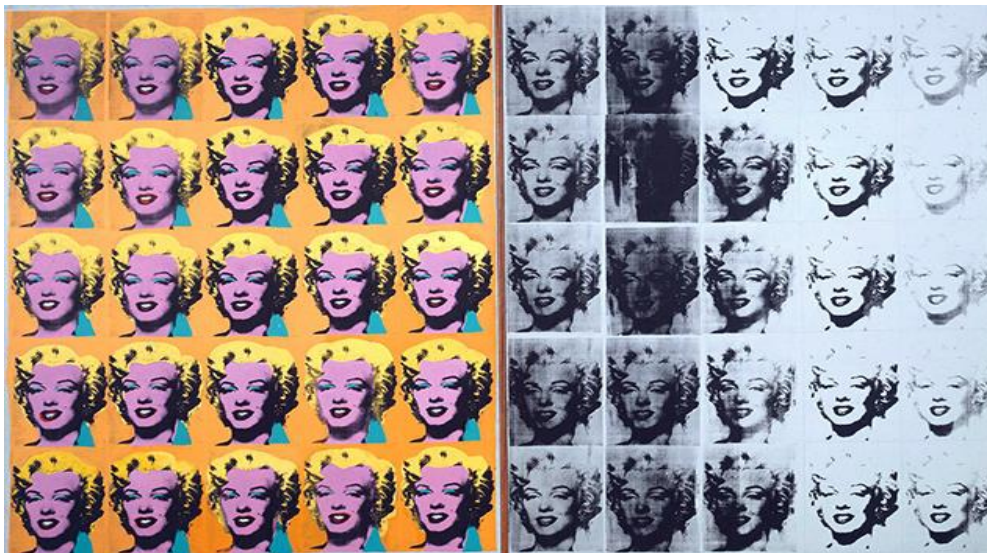
Figura 4. Andy Warhol, Marilyn Diptych , 1962, acrylic on canvas, 2054 x 1448 cm.

consumir objetos ou coisas, mas também, pessoas, os ícones daquela sociedade, como Marilyn Monroe e Elvis Presley, por exemplo. Esses dilemas socioeconômicos e políticos, também ressurgem na produção de Vik Muniz e evidenciam a influência dos artistas pop sobre sua produção.