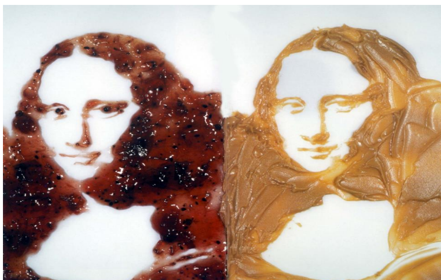
Figura 5. Vik Muniz, Mona Lisa de geleia de uva e de manteiga de amendoim, 1999.

Suas obras são caracterizadas por ideias, no mínimo, singulares. O artista é conhecido por produzir quadros utilizando materiais raramente associados à arte, como geleias, xaropes, terra, chocolate, açúcar, diamantes, lixo, entre outros. Muniz busca criar registros visuais que o público possa reconhecer, principalmente com materiais e objetos que a maioria das pessoas teriam em suas casas.