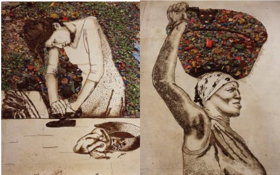
Figura 6. Vik Muniz, Pictures of Garbage: Woman Ironing (Isis); The Bearer (Irmã), 2008.