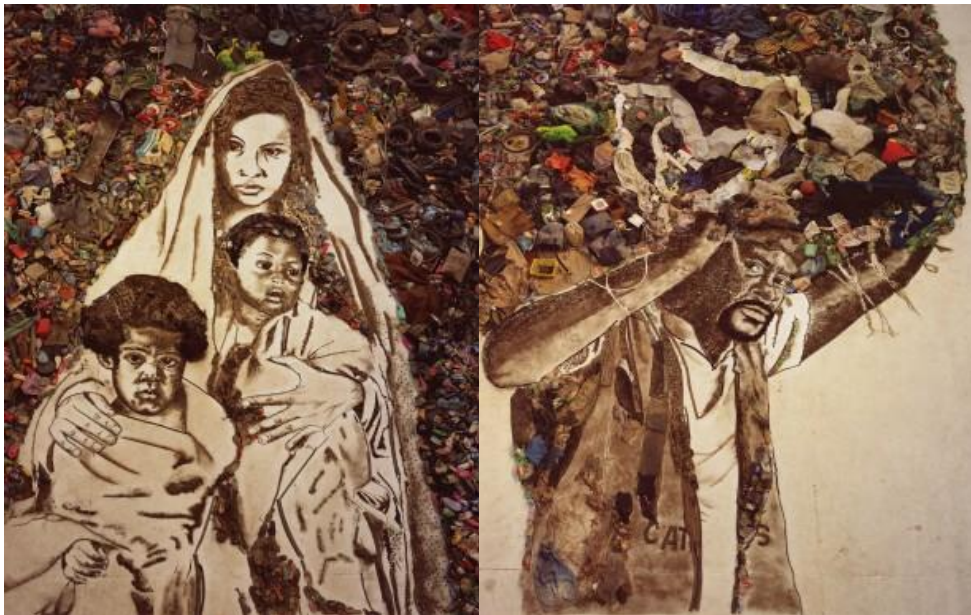
Figura 8. Vik Muniz, Pictures of Garbage: Mother and Children (Suellen); Atlas (Carlão), 2008.

Certeau 36 ao analisar as possíveis relações entre a arte com o lixo, no caso, da arte com a sucata, compreende essa construção a partir de uma estrutura social de poder. A utilização da sucata é vista pelo autor “como golpes no terreno da ordem estabelecida, pois o trabalho com sucata reintroduz no espaço industrial as táticas populares de outrora ou de outros espaços”. 37