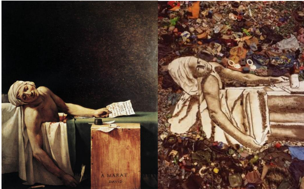
Figura 9. Jacques-Louis David, A Morte de Marat , 1793. Óleo s/ tela, 165 x 128 cm; Vik Muniz, Pictures of Garbage: Marat (Sebastião) , 2008. Digital c-print, 231.2 x 180.4 cm.

entre os catadores de Gramacho. São esses elementos que o artista buscou explorar para construir seu retrato: Marat (Sebastião) - Retratos do Lixo .