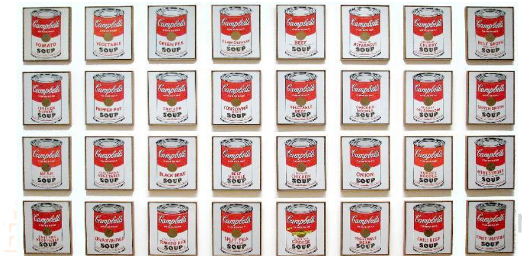
Figura 3. Andy Warhol, Latas de Sopa Campbell , 1962, tinta de polímero sintético sobre tela, 50,8 × 40,6 cm.

O olhar de Warhol acerca do contexto histórico onde estava inserido, reflete diretamente em suas criações. Archer 24 afirma que o artista ao utilizar séries de imagens e figuras repetidas estava dialogando com outras linguagens, como a televisão e o cinema e, com os ícones da cultura popular que estavam sendo consagrados por essas mídias. Também deve-se destacar que a Pop Art além de ser uma produção artística se tornou uma comunicação visual. 25