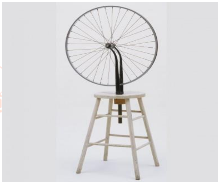
Figura 2. Marcel Duchamp, Bicycle Wheel , madeira e metal, 63.5 x 41.9 cm.

Vale destacarmos, que o primeiro ready-made de Duchamp foi realizado em 1913, tratava-se de uma roda de bicicleta montada sobre um banquinho de madeira (Figura 2). Como a roda estava parafusada de ponta-cabeça, é possível girá-la livremente e sem grande esforço. O artista ao desconstruir o objeto, ou melhor, ao desmontar a bicicleta, se propôs a dialogar com a produção industrial e com a concepção de objeto artístico. Na obra, tanto a roda como o banco foram mantidos em suas formas primárias, como “originais de fábrica”. No entanto, o artista designou outra função para esses dois artefatos, transmutando-os em um terceiro, cuja criação rompe com os padrões preestabelecidos pelo modelo industrial, criando uma nova categoria de arte. 20