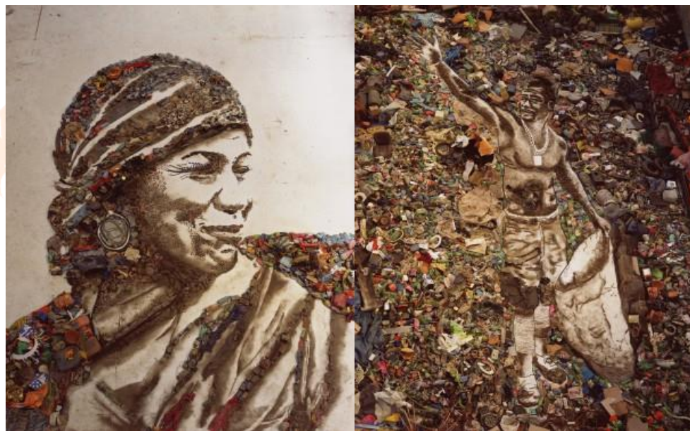
Figura 7. Vik Muniz, Pictures of Garbage: The Gipsy (Magna); The Sower (Zumbi), 2008.