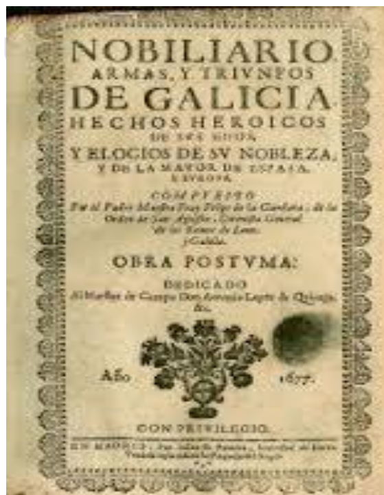
Figura 8. Capa do Nobiliário, Armas e Triunfos de Galícia

Era uma pintura de história e será recebida de maneira diversa pelos críticos que a avaliaram na Exposição Nacional de Bellas Artes de Madrid, em 1887. Antes de