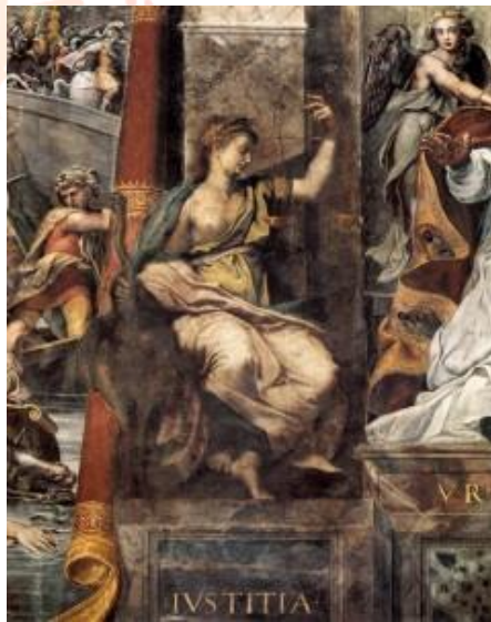
Figura 3. Rafael Sanzio. Afresco .1520.

Maria Cabrera Massé enfatiza dois aspectos que considera importantes na estadia de Brocos em Roma: primeiro, a prevalência do gosto pela pintura histórica que predominava no ensino acadêmico de arte no século XIX, e segundo, as reclamações empreendidas por Brocos acerca da situação das Academias em Roma e dos artistas que dependiam da pensão em uma carta publicada no Jornal A Voz de Galicia em 21 de abril de 1884. Nela, Brocos reclamou que os artistas não vendiam e os marchands estavam com as obras paradas na vitrine, que nem aquarelas, que eram mais baratas eram vendidas. Argumentou que a renda era necessária para pagar modelos e que o dinheiro da pensão não dava para nada além de custear os gastos básicos de um artista. Informa, ainda, do fechamento da Academia Gigi e de sua concorrente, a Academia de Canovas e que no Círculo Artístico Internacional não houve aulas de aquarela por falta de alunos. Conclui dizendo: “escuso dizer-lhes que a situação dos artistas em Roma é extremamente penosa”. 10 Já aqui Brocos começa a comparar a Itália e Paris para considerar que Paris era bem “mais compreensiva” em aceitar e ajudar novos artistas estrangeiros. 11