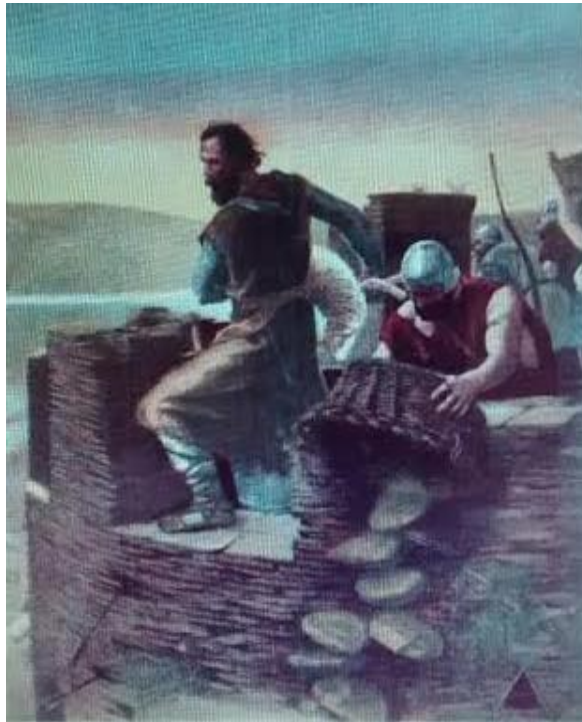
Figura 7. Modesto Brocos. La Defensa de Lugo . 1887. Óleo sobre Tela, 331x252cm. Centro Galego de Havana