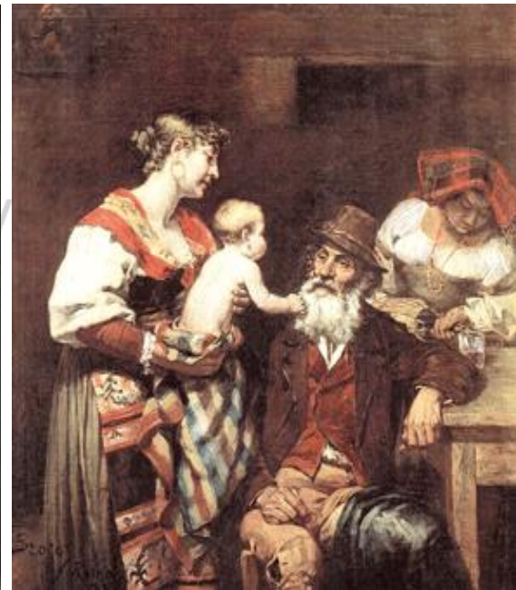
Figura 6. M. Brocos . Las Tres Edades . 1888. Óleo sobre tela 68 x 48 cm - Deputación da Coruña