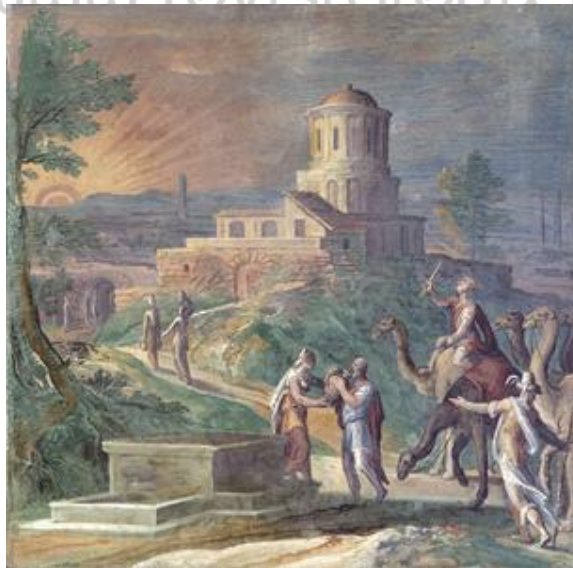
Figura 2 - Modesto Brocos. Rebeca dando de beber a Eliézer (1883). Deputación de La Coruña

A concessão da bolsa obrigou Brocos a pintar uma série de quadros logo em seguida: no primeiro ano deveria fazer uma cópia de um quadro antigo, de um renomado pintor, quando executou o quadro La Justicia (Figura 3) uma cópia de Rafael (Figura 4). No segundo teria que pintar uma só figura de tamanho natural, quando ele realiza o quadro Nu de Hombre (Figura 5) e, por último, deveria se ocupar com um quadro de história, sendo Las Três Edades (Figura 6) o tema eleito pelo artista. É como resultado desse pensionato em Roma que Brocos executa a obra La Defensa de Lugo (1887), tela que recebe menção honrosa na Exposição Nacional de Bellas Artes, em 1887 9 , quando Brocos tinha 35 anos.