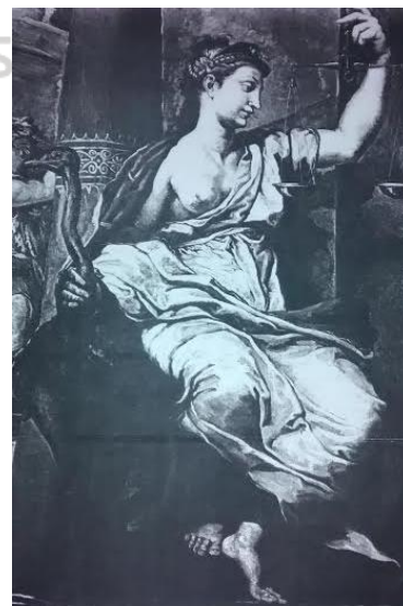
Figura 4. Modesto Brocos. A Xustiza . Óleo sobre tela, 207 x 143 Deputación da Coruña