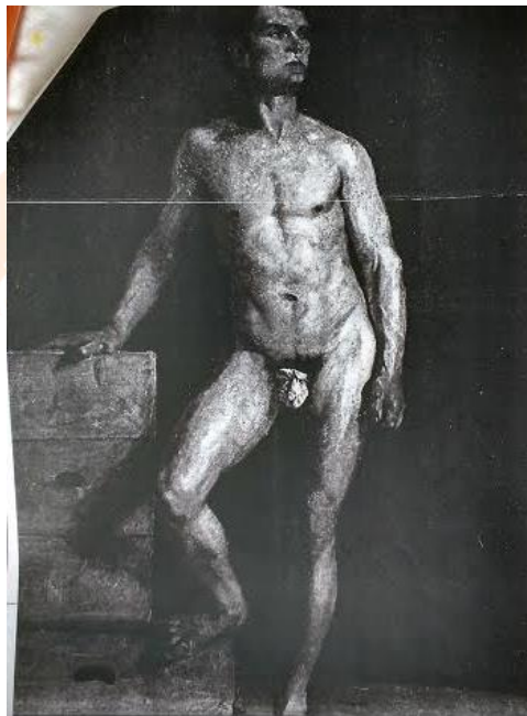
Figura 5. Modesto Brocos Nu de Hombre . c.a 1884 Óleo sobre tela 143 x 143cm - Deputación da Coruña

No Brasil, ocorreu um movimento mais específico, a pintura histórica e a retratística oficial serão valorizadas pela Academia na década de 1850, na gestão de Manuel de Araújo Porto Alegre (1854-1857). A paisagem que, por sua vez, se manterá como um gênero menor na hierarquia estabelecida na Espanha, no Brasil, ao contrário, será bastante valorizado por ser considerado como elemento fundante na construção da identidade no Império. 12