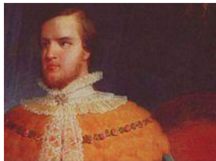
Sérgio Buarque de Holanda Capítulos de história do Império

Nunca é demais lembrar: tudo o que foi feito, desde o mês de dezembro de 2004, em prol da melhoria, expansão e diversificação deste periódico científico, deveu-se ao envolvimento da Secretaria Executiva, dos Conselhos Editorial e Consultivo, bem como de nosso Webmaster. O desprendimento e a coragem dos diretamente envolvidos nessa empreitada foram de grande importância para o bom encaminhamento dos trabalhos, mantendo a qualidade editorial e publicando artigos de excelência. Acima de tudo, queremos expressar nossos mais sinceros agradecimentos a todos aqueles que, acessando o site ou enviando seus artigos, contribuem para que a Fênix – Revista de História e Estudos Culturais seja tão bem recebida. Devemos aqui registrar uma especial menção aos nossos leitores e colaboradores: sem eles, nada disso teria sido possível.