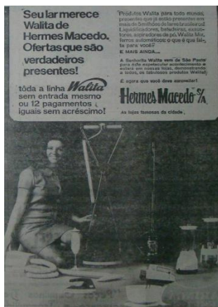
Imagem 7 – Folha do Norte do Paraná 07 de setembro de 1969, p. 5-A.