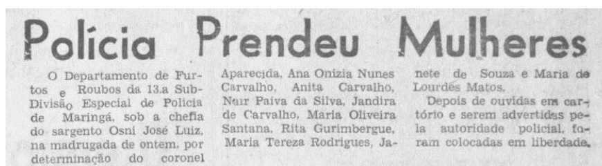
Imagem 5 – Folha do Norte do Paraná, 09 de fevereiro de 1968, p. 10.

Quando não são vítimas, nas ocorrências policiais, as mulheres aparecem com frequência relacionadas aos temas prostituição, vadiagem, embriaguês e por trottoir . 15 As matérias informam sobre a prisão dessas mulheres e as medidas que a prefeitura e a polícia tomavam para livrar o centro da cidade da presença indesejável.