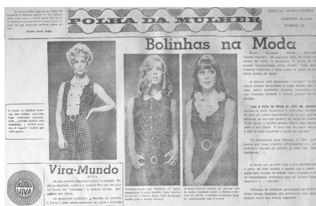
Imagem 1 – Folha do Norte do Paraná (Folha da Mulher), 28 de abril de 1968, p. 8.

uma página, localizada em geral na página 08. Na “Folha da Mulher” são frequentes as matérias sobre moda, exercícios físicos para um corpo magro, dicas de beleza, cremes, cuidados com o cabelo e pele, sugestões sobre maquiagem e culinária. Esses conteúdos indicam a valorização e cuidado que a mulher deveria ter principalmente para com seu corpo, em vista da beleza física e boa apresentação. Ao analisar anúncios publicitários da Revista Capricho veiculados nas décadas de 1950 e 1960, Miguel afirma que a mulher deveria “cuidar de si, mas não unicamente para sentir-se bem, mas, principalmente, para agradar o outro, leia-se, aí, o marido, noivo ou namorado”. 9