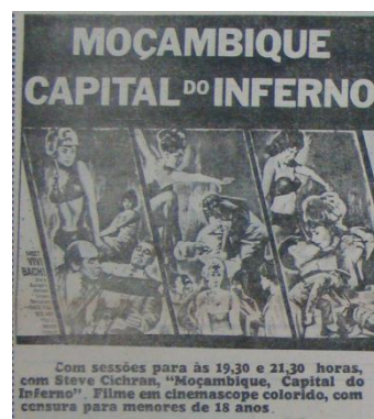
Imagem 10 – Folha do Norte do Paraná, 23 de agosto de 1969, p. 3-B

Segundo Beleli, ao analisar propagandas vencedoras publicadas nos Anuários, “alusões à sexualidade são estímulos que prendem a atenção do consumidor”. 23 Para Vestergaard e Schröder, a utilização da imagem feminina nas propagandas