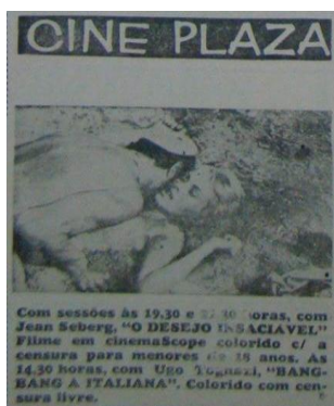
Imagem 9 – Folha do Norte do Paraná 01 de junho de 1969, p. 3-B.

Já dentre as propagandas destinadas ao público masculino, embora haja a presença feminina na divulgação de produtos como veículos e bebidas, o que chama a atenção são as propagandas que anunciam filmes em cartaz nos cinemas, e que, a partir de 1969 passam a ser divulgados utilizando-se também de imagens. Em tais propagandas, aparecem mulheres em fotos sensuais e com pouca roupa, em cena que representam os filmes em geral destinados ao público adulto (Imagens 9 e 10).