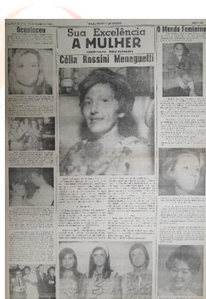
Imagem 3 – Folha do Norte do Paraná, 15 de fevereiro de 1969, p. 5-A.

A coluna “Sua Excelência a Mulher”, exemplificada pela Imagem 3, era publicada às quartas-feiras e aos sábados, ocupando em geral uma página inteira. Apresenta uma estrutura diferente da “Folha da Mulher”, assemelhando-se a uma coluna social, e dividida em três partes. A primeira delas, ao lado esquerdo, com o título Aconteceu , eram publicadas matérias sobre eventos que ocorriam na sociedade, como casamentos, aniversários, desfiles de modas. Essas notas, algumas delas com fotos, davam destaque, em sua maioria, a mulheres e sua participação nos eventos sociais. A parte central da página era dedicada a entrevistas com mulheres, abordando questões sobre o nascimento da entrevistada, sua formação, seu marido, seus filhos e, para as que trabalhavam fora do lar, era também comentado sobre suas carreiras e de que forma conciliavam os cuidados com a casa, o marido e os filhos. Ao lado direito da coluna, existia um espaço com o nome O Mundo Feminino , onde eram publicadas notas sobre nascimento de crianças, eventos sociais, casamentos, desfiles de moda, entre outros, com conteúdo semelhante ao publicado no espaço Aconteceu .