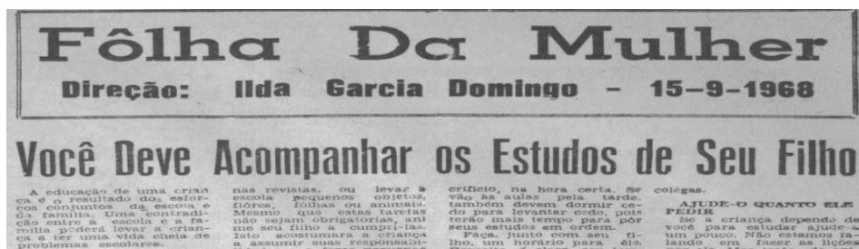
Imagem 2 – Folha do Norte do Paraná (Folha da Mulher), 15 de setembro de 1968, p. 3.

Outro assunto que aparece com frequência nas colunas femininas refere-se à função da mulher diante da educação e do desenvolvimento das crianças. Encontramos matérias que fazem referência a teorias psicológicas, como a de Jean Piaget, que deveriam embasar o cuidado da família na educação dos filhos.