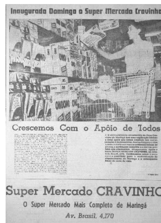
Imagem 8 – Folha do Norte do Paraná 09 de abril de 1968, p. 6.

A Imagem 7 trata de uma propaganda de utensílios doméstico como liquidificador, ferro elétrico de passar roupa, enceradeira. A mulher apresenta-se sorridente, radiante e elegante, denotando contentamento diante das facilidades trazidas pelos “fabulosos produtos” que estão “presentes em mais de 5 milhões de lares brasileiros”. Ao final, a propaganda arremata: “o que é que falta para você?”. Na Imagem 8, uma propaganda de supermercado, podemos ver uma mulher com uma criança, escolhendo um detergente em pó na seção de produtos de limpeza. Mais uma vez, a mulher é utilizada na propaganda associando sua função ao mundo privado, doméstico, do lar, onde teria a responsabilidade pelo cuidado dos filhos e marido.