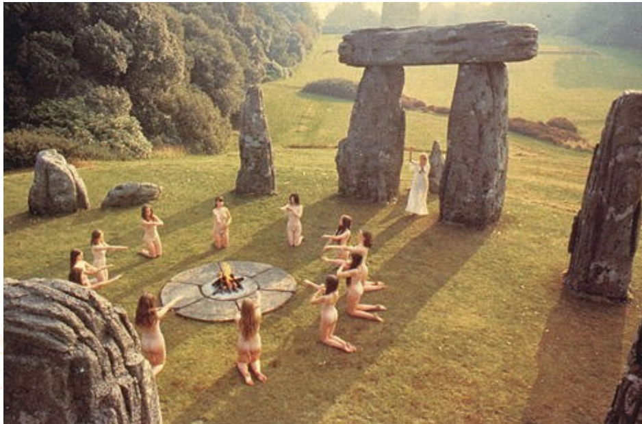
Imagem 1: Cena do filme O Homem de palha, 1973. Jovens realizam ritual em volta de uma fogueira para o deus Belenos (divindade Celta comemorada no 1º. de maio, Beltane), invocando fertilidade.

inspirada diretamente em Gerald Gardner – no filme, seu bisavô teria feito ressurgir o antigo culto na ilha de Summerisle, durante o século XIX. Além de líder, ele promove a correta realização dos rituais e a ordem na comunidade. Uma das principais cenas do filme – a nudez ritual de jovens mulheres em um círculo com fogueira central, evoca diretamente a wicca . Ao lado deste círculo, o filme retrata uma série de megálitos semelhantes a Stonehenge – considerado pelos neo-druidas e por muitos neo-paganistas desde o Oitocentos como sendo de origem Celta. 12