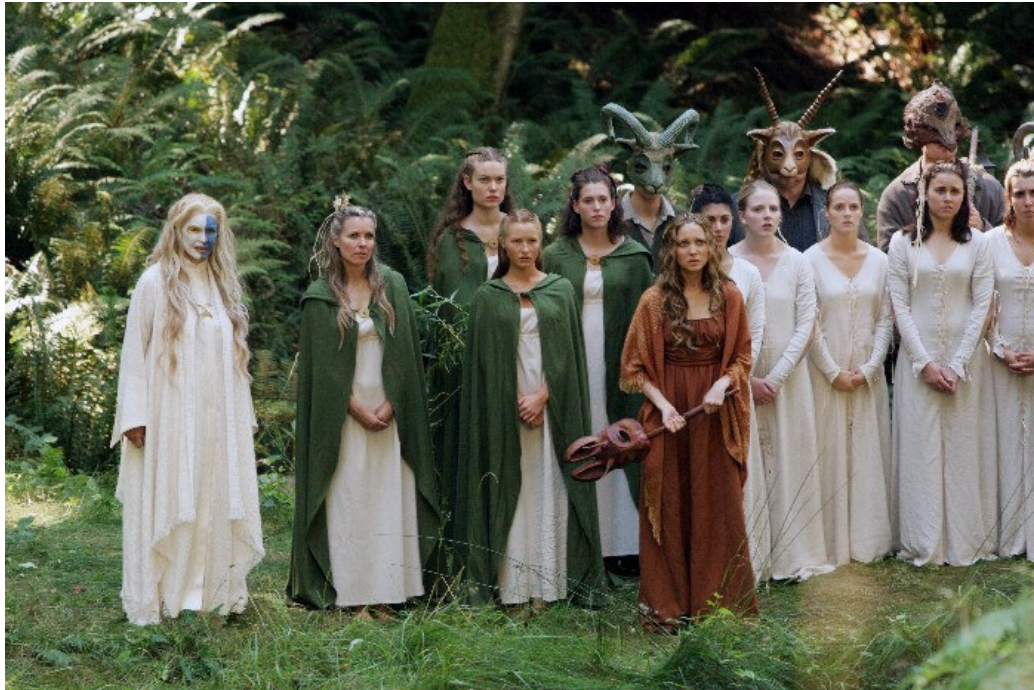
Imagem 2: Cena do filme O sacrifício , 2006, representando a summa sacerdotisa e as adeptas da religião feminina de Summerisle.

imolação dentro do referencial das próprias sociedades antigas que o praticavam, portanto, sem o anacronismo moralista do referencial judaico-cristão. 42