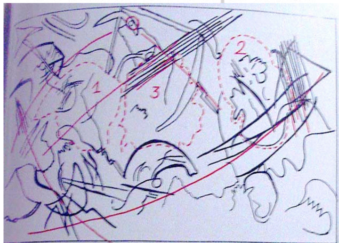
Lignes maîtresses de Composition VI (1913) Wassily Kandinsky

O último enunciado antes se parece a uma provocação. E ela o é de fato: não só se afirma que há duas modalidades de abstração, senão que aquela que privilegiamos realiza a mímesis. Essa, pois, em vez de ser concebida como o que nega a potencialidade inventiva do sujeito, mostra-se como o meio que assegura ao sujeito autônomo que não reduza o mundo à arbitrariedade subjetiva. A mímesis, em vez de supor subordinação a modelos, implica a independência dos meios com que operou o sujeito. Implica, pois, não o escapar do mundo, mas a intervenção nele. Assim o abstrato não se confunde nem com a fuga do mundo, com o conseqüente refúgio do sujeito em sua intencionalidade, nem a criação de outro mundo (!), senão que a audácia de reconfigurá-lo. Ao admiti-lo, nos permitimos sair do pan-subjetivismo que, discretamente, Jean-Luc Nancy denunciara.