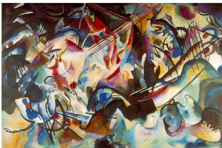
Composição VI (1913) Wassily Kandinsky

Assim sucede que todos estes elementos, mesmo os que se contradizem entre si, alcançam internamente um equilíbrio total, de tal modo que nenhum elemento prepondera, enquanto que o motivo original de que surgiu o quadro (O Dilúvio) se dissolve e é transformado em uma existência interna, puramente pictórica, independente e objetiva. Nada seria mais enganador do que intitular essa pintura de representação de um evento. 20